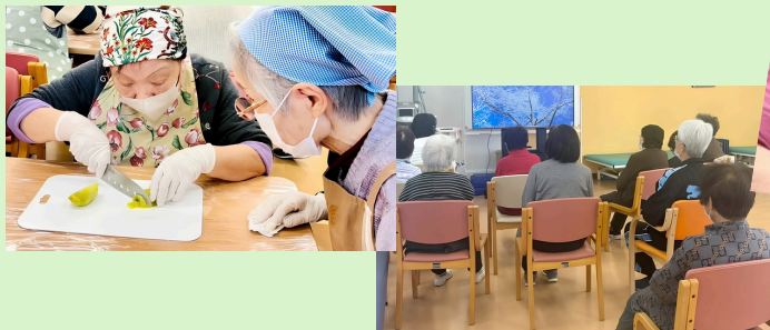
食レクや歌クラブ